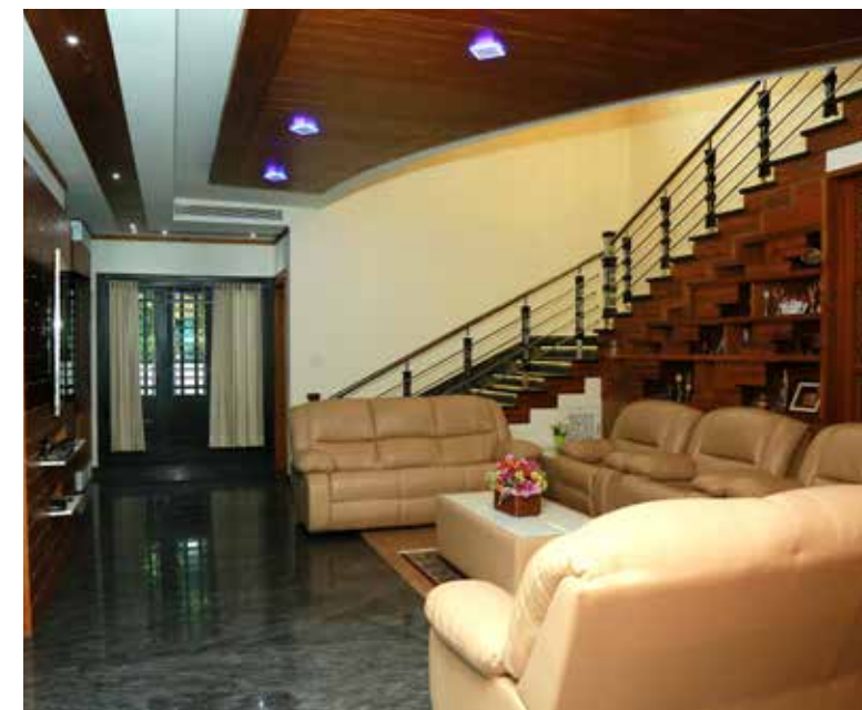
▲ മുകൾ നിലയിലേക്ക് പോകുന്ന സ്റ്റെയറിനടുകിലായിട്ടാണ് ഫാമിലി ലിവിംഗ്.