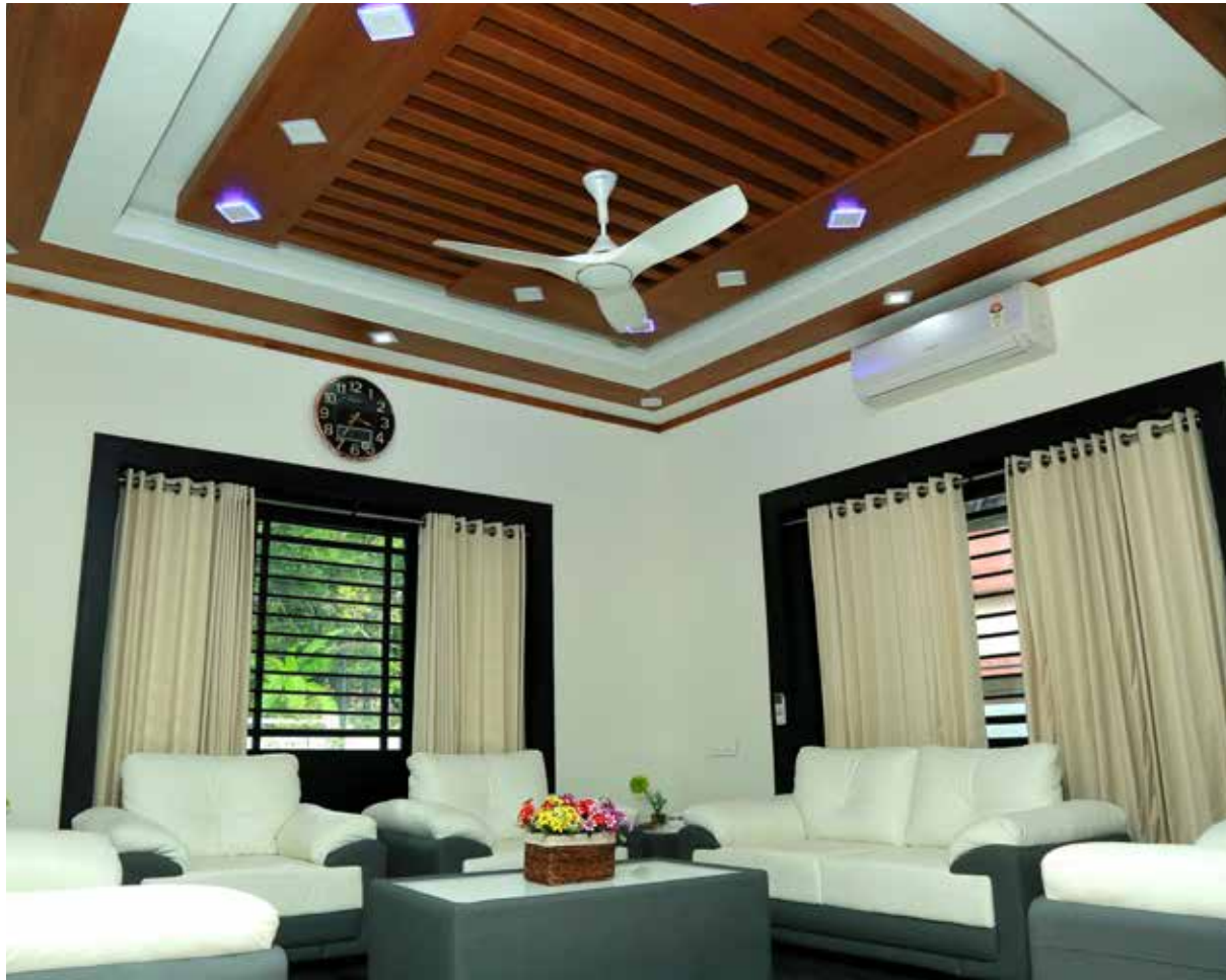
▲ ആഡംബരത്തിന്റെ മാറ്റ് ഒട്ടും കുറയാതെയാണ് ഡ്രോയിംഗ് റൂം ഒരുക്കിയിരിക്കുന്നത്.

തെയാണ് ഡ്രോയിംഗ് റൂം ഒരുക്കിയിരിക്കുന്നത്. വിശാലമായ ജാലകങ്ങൾ മുറികളിൽ ധാരാളം കാറ്റും വെളിച്ചവുമെത്തിക്കുന്നു. സീലിംഗ് തയ്യാറാക്കിയിരിക്കുന്നത് ജിപ്സവും വെനീറും ഉപയോഗിച്ചാണ്. മികച്ച പ്രകാശ സംവിധാനവും സീകരണമുറിയുടെ പ്രവർത്തിപ്പിക്കുന്നു. പ്രൈവസിക്യൂം പ്രാധാന്യം നൽകിയാണ് അകത്തളസൗകര്യങ്ങൾ ചിട്ടപ്പെടുത്തിയിട്ടുള്ളത്. ഫോയറിൽ നിന്നാണ് സീകരണ മുറിയിലേക്ക് എത്തുന്നത്. ആധുനികരംഗ സജ്ജീകരണങ്ങൾ എല്ലാം ഒത്തിണങ്ങുന്നതാണ് സീകരണമുറി. ഫണ്ട്ഷനും ഭംഗിക്കും തുല്യ പ്രാധാന്യം നൽകിയാണ് ഡ്രോയിംഗ് റൂം ഒരുക്കിയിരിക്കുന്നത്.